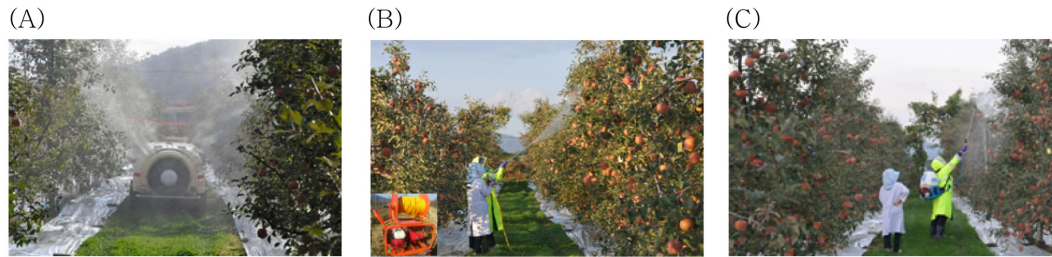
Fig. 1. Spray of speed sprayer (A), power sprayer (B) and knapsack motorized sprayer (C) in apple orchard.